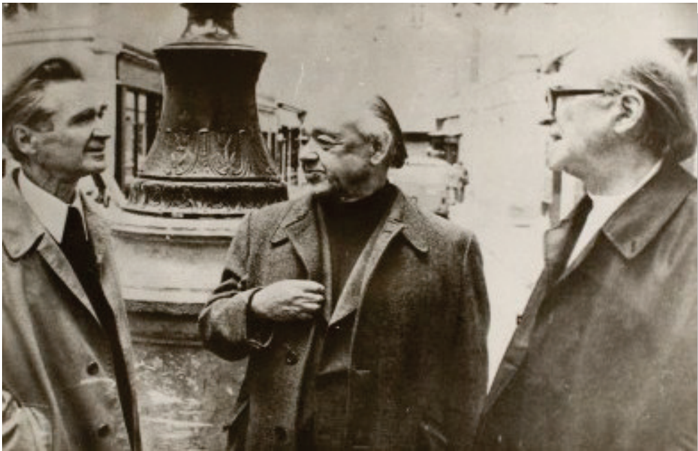
(Emil Cioran, Eugen Ionescu și Mircea Eliade)